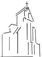
St Julien (Le Fauga)