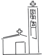
St Leger (Eaunes)